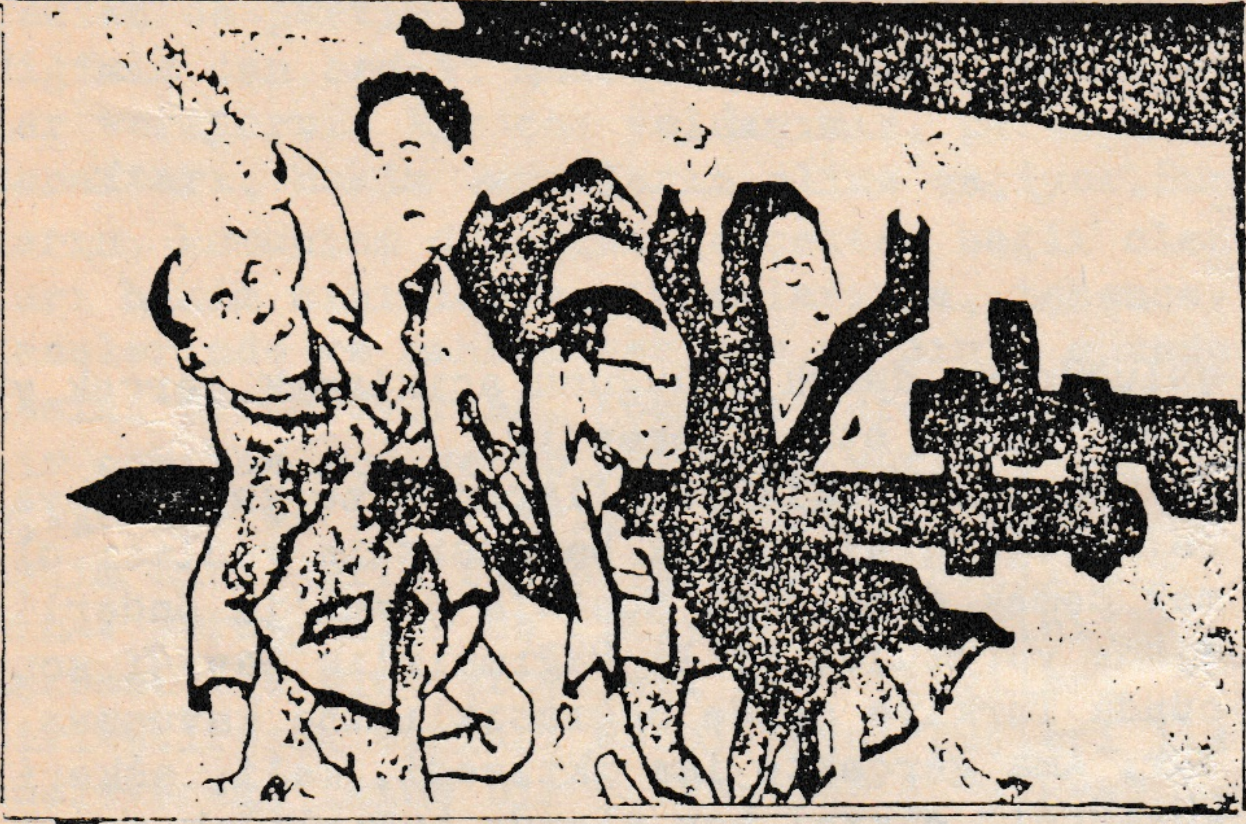
ÇİN'Lİ REVİZYONİSTLERİN "4'LÜ ÇETE"Yİ HEDEF ALAN POSTERLERİNDEN BİRİ.

Çin'de "4'lü çete"nin yargılandığı geçtiğimiz ayda, Çin'li revizyonistlerin iktidarı tümü ile ele geçirmelerinden bu yana Mao Zedung'a ve Kültür Devrimine saldırıları bir kez daha açık bir şekilde gözler önüne serildi.