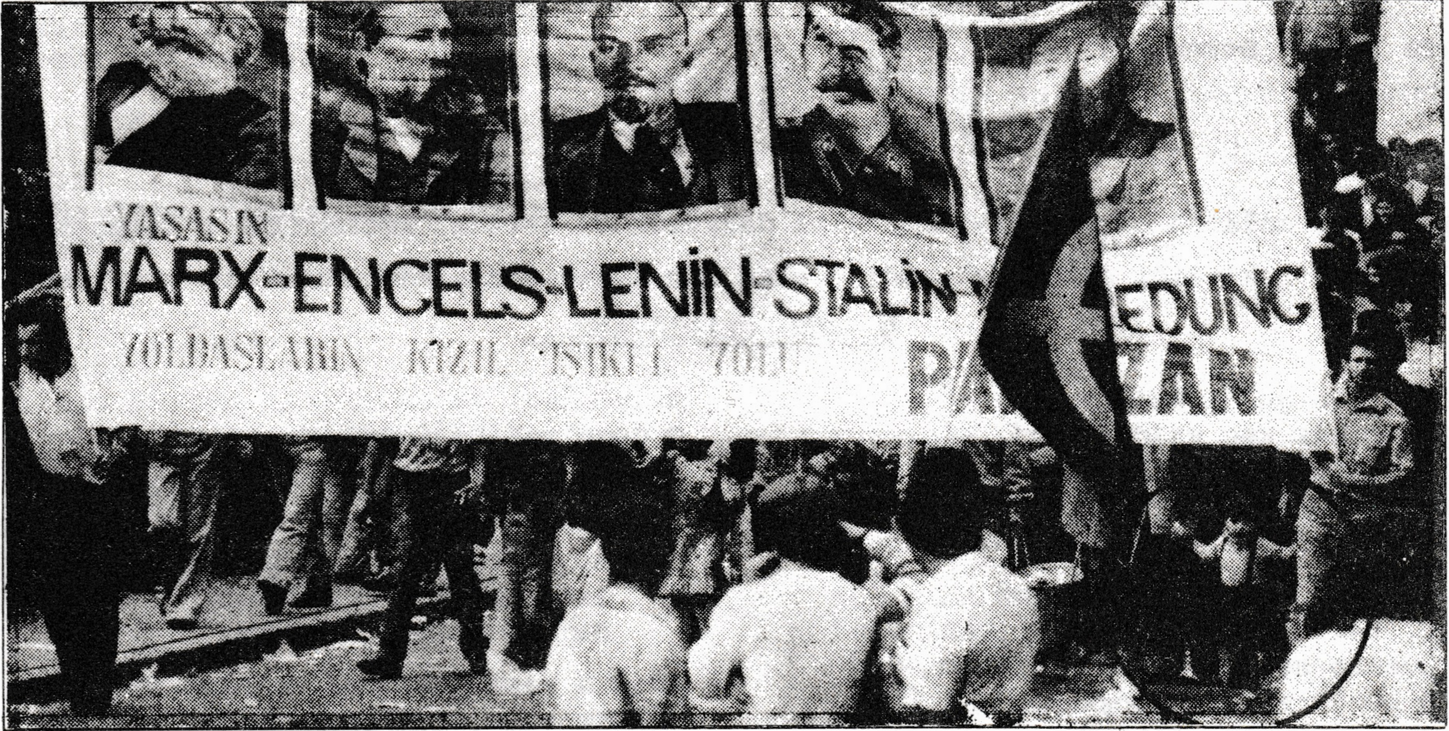
Üstteki ve alttaki resimler, 12 Eylül 1982 tarihli Hürriyet gazetesinden alınmıştır.

Ne emperyalizm, sosyal-emperyalizm ve her türden gericiilik, ne de ABD uşağı faşist cunta halkın mücadelesini ve onun örgütleyicileri olan devrimci örgüt-