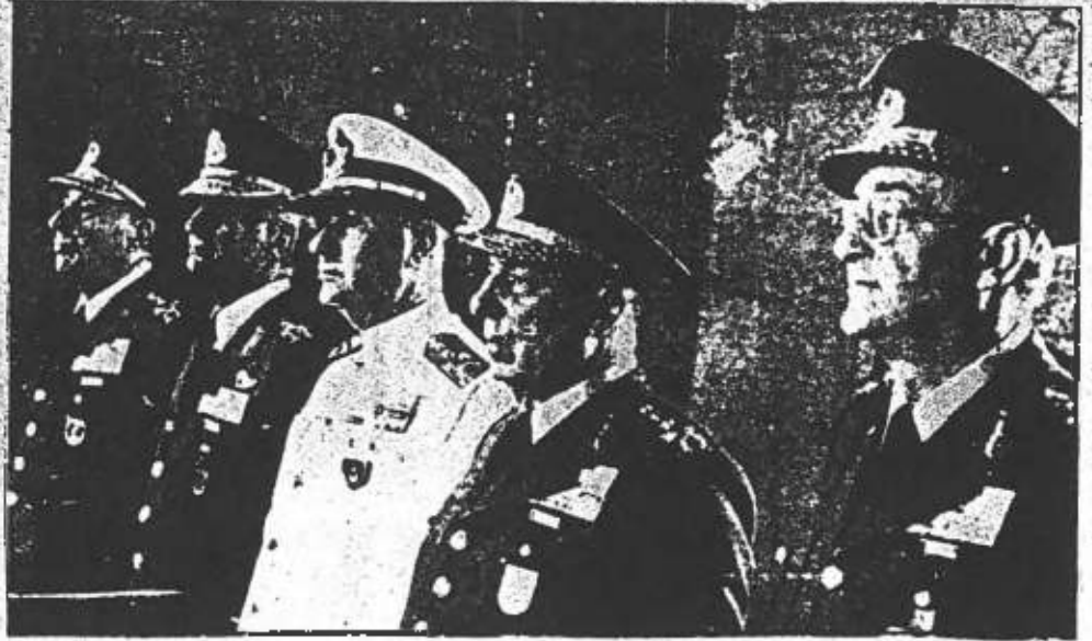
Askeri darbenin önde gelen faşist generalleri:(soldan sağa) Orgeneral Ersin, Orgeneral Şahinkaya, Oraniral Tümer, Orgeneral Celasun, Orgeneral Saltık

düşüncesini yaymaya çalışacaklar. Onların bu yaptığı bir sahtekarıktır. Faşist ordu da, parlamento da aynı sınıflara; emperyalizme ve uşaklarına, onların faşist düzenine hizmet eden araçlardır. Bugün hakim sınıfların parlamento dağıtması, parlamento nun şu anda halkı kandırma fonksiyonunu önemli ölçüde yitirdiğinden, parlamento halk içinde duyulan güvenin iyice sarımsı olmasından kaynaklanmaktadır. Darbeciler bu davranışla halkın bir kesiminin sempatisini kazanmayı düşünmektedir. İlerde hakim sınıflar parlamento aracını yine halkın karşısına çıkaracaklardır. Parlamento un dağıtılması ile aynı zamanda "sınıflar üzeri olma" demogojisi güçlendirilmeye çalışılmaktadır. Ama hiç bir demogoji parlamento nun da, ordunun da aynı sınıflara hizmet eden araçlar olduğu gerçeğini karartamaz.