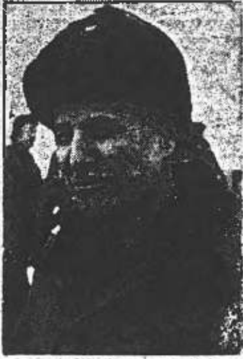
Darbe sonrası halka kan kusturmak için kurulan Milli Güvenlik Konseyinin başkanı Faşist Orgeneral Kenan Evren