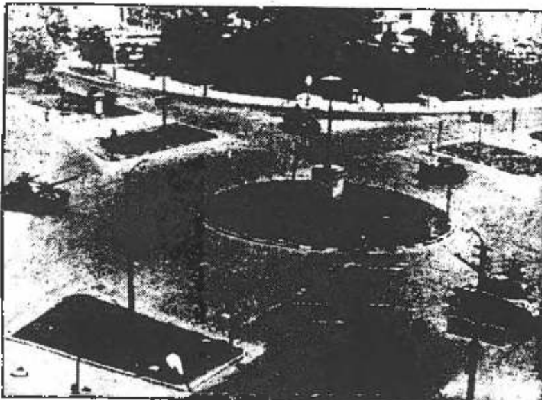
Askeri birlikler şehir içinde boy göstererek, taratarak halkımızı yıldıracaklarını sanıyorlar.