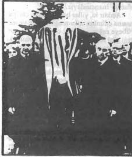
Taburcu baş ucunda Kamiz Ali ve Başbakan Adil Çarçani

Arnavutluk haber ajansı, 9 Nisan 1985 sabahı geçirdiği bir kalp krizi sonucu komaya giren, ancak iki gün süren yoğun çabalara rağmen kurtarılamayan Enver Hoca'nın ölüm haberini yayınladığı bir bültenle tüm dünyaya ilan etti.