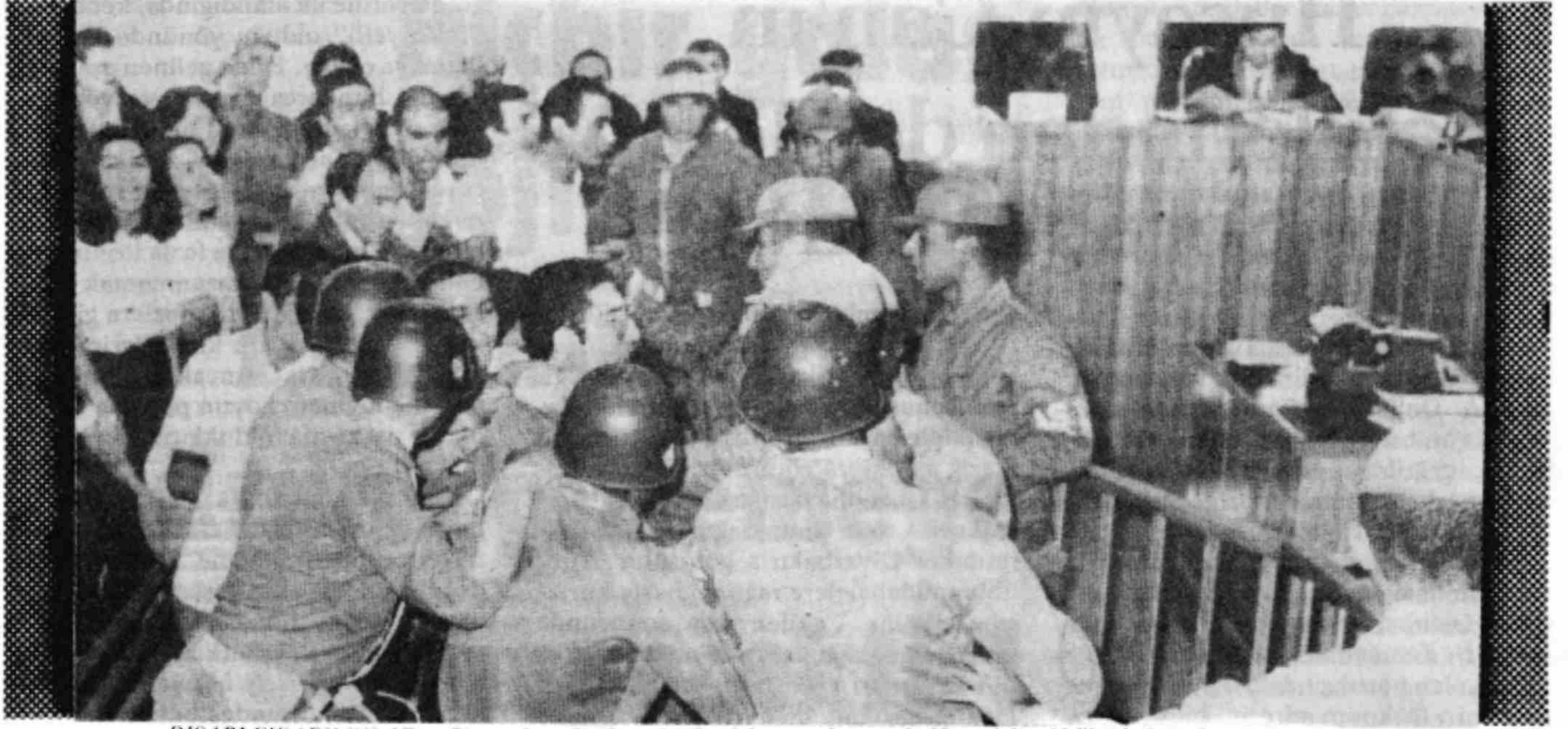
DIŞARI ÇIKARILDILAR — Bir sanığın salondan çıkarılmak istenmesi sırasında 12 sanık hep birlikte bağırarak çeşitli sloganlar attılar ve arkadaşlarını vermek istemediler. Sanıklar ile görevli askerler arasında bir süre itişip kakışma oldu.