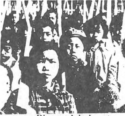
Bina ve Iskele

İKK'nın yeterince kavranamayan bu özelliği de derinliğine kavranmalı ve onun üzerine düşen bu fonksiyonunu daha iyi oynayabilmesi açısından gereken çaba daha bilinçlice sarfedilmelidir.