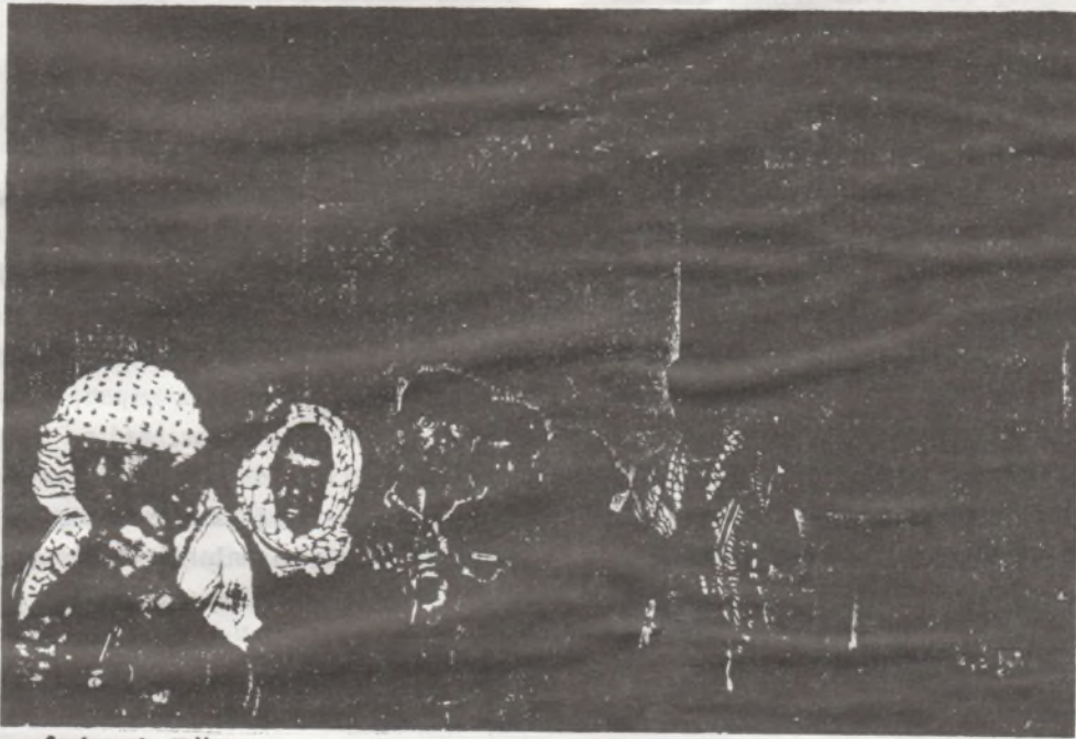
Askeri Eğitim Kampından Bir Görüntü

yünü erken saatlerde ablukaya alan ve köyde sokağa çıkma yasağı ilan eden faşist ordu, akşam saatlerinde evden çıkışları da yasaklamıştır. Köyün dört bir yanında mevzilenerek pusu kurmuşlardır. sayısı yüzü aşkın faşizmin silahlı güçleri, iştahla,köye girebilecek gerillaların beklentisi içindeydiler. Olup bitenlerden habersiz olan gerilla birliğimiz ise, sessizce köye doğru ilerliyordu. Gerillalar pusu kurulan köye yaklaşınca,kendi görevlerinden dolayı iki gruba ayrıldılar. Birinci kol, başka bir köye gitmek için diğer koldan ayrıldı. Köye girecek olan gerilla